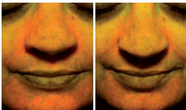
Du point de vue visuel, la variation est objectivée par les photographies en fluorescence (Fig.4). Chaque petit point orangé représente un pore obstrué.